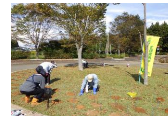
2023/10/25 チューリップの植付け