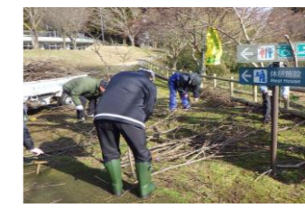
2023/1/23 伐採済みの桜の枝処理