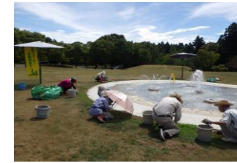
2023/8/31 ふんすい周りの除草