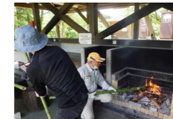
2023/6/21 団体利用補助(バームクーヘンづくり)