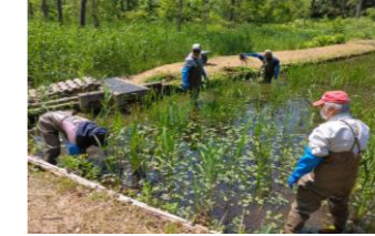
2023/5/10 ジュンサイ池の除草