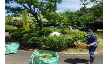
2023/5/31 北口駐車場の植栽元の除草