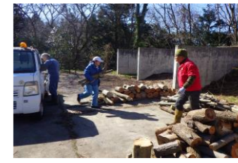
2023/2/17 支障木の運搬・集積・配布