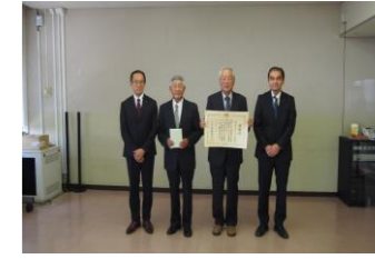
2023/7/4 第34回「みどりの愛護」のつどい功労者 国土交通大臣表彰伝達式