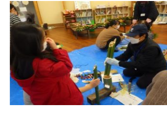
2023/12/17 門松づくり教室のサポート