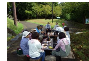
2023/9/7 「みどりの愛護」功労者国土大臣表彰 受賞記念茶話会