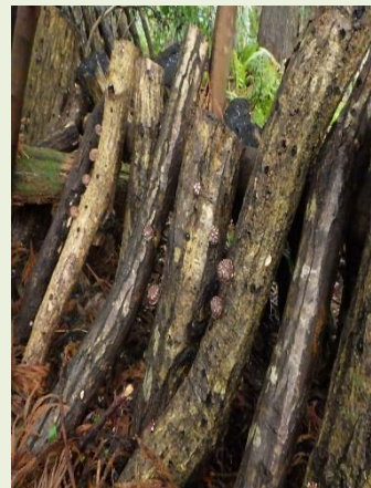
写真:「シイタケの森」の様子