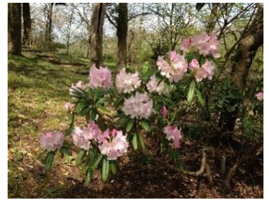
(古墳エリア) で見られます！