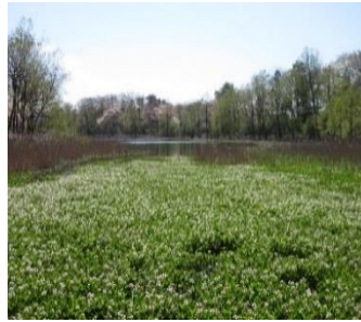
(西水上回廊) で見られます！