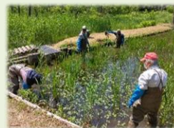
写真：じゅんさい池の清掃