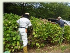
写真：アジサイの剪定