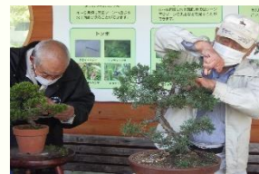
写真：開催時の様子

講師 大潟盆栽水石愛好会の皆様 時間 13:30～15:00 会場 ふんすい回廊 参加費 1000 円 定員 10 名 ※先着順 事前申込み 必要 準備 汚れてもよい服装・軍手など