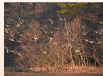
冬鳥 (マガンの群れ)