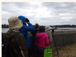
写真:開催時の様子