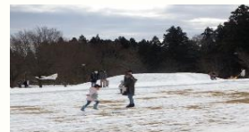
写真：開催時の様子