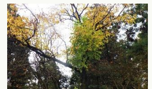
写真：マグワの大木