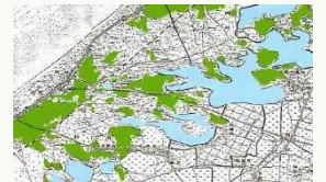
明治43年の地形図（緑色が桑畑） 「私たちの大潟」より

12月、養蚕の証しともいえる公園のマグワは、葉を黄色に変え、寒空に立っています。見上げてみませんか。