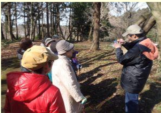
写真：開催時の様子

時間 10:00~11:30 集合場所 公園事務所 参加費 無料 定員 10名 事前申込み 必要 ※先着順 準備 暖かく動きやすい服装 ※マスク着用をお願いします