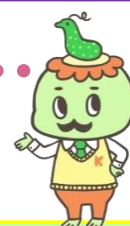
大潟水と森公園PRキャラクター かっぱかせ

Twitter・facebookも更新中！ 大潟水と森公園 @mizutomori フォロー・いいね！お待ちしております★