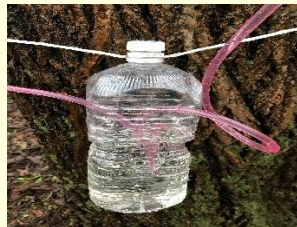
写真：樹液採取の様子