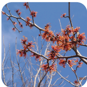
マンサクの園芸品種

マンサクは春一番に「まず咲く」ことから名付けられました。公園には新潟の山林に見られるマルバマンサクの他、野鳥観察ゾーンでは花が咲く時にも枯れた葉が残るシナマンサクの交配種で、赤い花を咲かせるものも見られます。