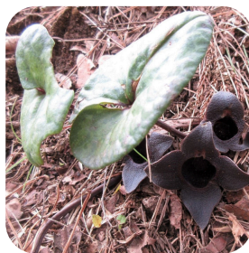
コシノカンアオイ

マンサクは春一番に「まず咲く」ことから名付けられました。公園には新潟の山林に見られるマルバマンサクの他、野鳥観察ゾーンでは花が咲く時にも枯れた葉が残るシナマンサクの交配種で、赤い花を咲かせるものも見られます。