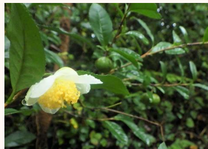
写真：お茶の花と実