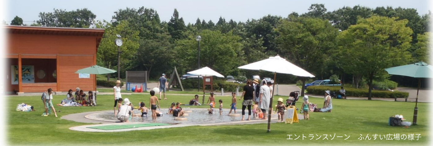
エントランスゾーン ふんすい広場の様子