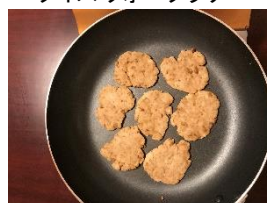
どんぐりクッキー

申込条件: 10名以上20名まで 参加対象: 親子または小学4年以上 参加費: 500円/名+炊事棟料金 (12名まで2,200円、12～20名4,400円) 所用時間: 2時間程度 内容: 簡易ピザ窯でピザづくりを体験します