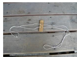
びゅんびゅんゴマ

申込条件: 10名以上20名まで 参加対象: 親子または小学生以上 参加費: 300円/名 所用時間: 1時間程度 内容: 竹でっぼうをつくり、紙玉でのあてに挑戦します