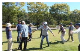
ネイチャーゲーム

申込条件: 10名以上 参加対象: 親子または小学生以上 参加費: 100円/名 所用時間: 1～3時間 内容: 公園内の数か所のポイントにクイズを設置します。自然・歴史・文化に関するクイズを解きながら公園内を散策できます