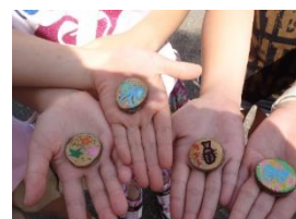
自然素材マグネット

申込条件: 10名以上 参加対象: 親子または小学生以上 参加費: 200円/名 所用時間: 30分程度 内容: 木の枝のスライスにイラストを描いたり、木の実をつけたりして、マグネットをつくります