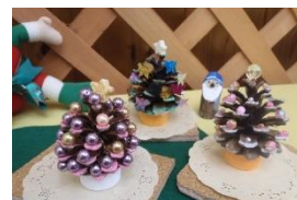
松ぼっくりツリー

申込条件: 10名以上20名まで 参加対象: 親子または小学生以上 参加費: 200円/名 所用時間: 1時間程度 内容: 松ぼっくりに飾りをつけたり、ペイントをしたりして小さなツリーをつくります