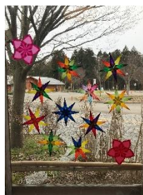
トランスパレント

申込条件: 10名程度 参加対象: 小学生以上 参加費: 200円/名 所用時間: 30分程度 内容: 薄い折り紙を折って重ねて、花や星をつくります