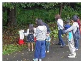
クイズウォークラリー