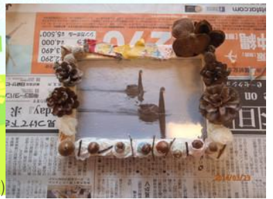
(参加者の作品です)

りぼんの形を作ったり、どんぐりにマスキングテープを巻いてみたり・・・アイディア満載の手作り写真立てができました！帰ったら早速、家族写真や、お友達との写真を飾る、という声が聞こえていました♪