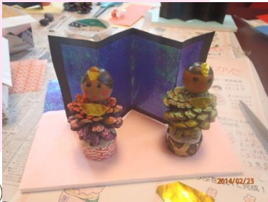
(参加者の作品です)

描くのはなかなか大変な作業・・・ですが、皆さんかわいらしく仕上がっていました！折り紙で屏風や扇子を作って完成！それぞれの個性が光る、とってもすてきなミニひな人形ができました♪