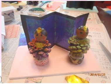
(参加者の作品です)

描くのはなかなか大変な作業・・・ですが、皆さんかわいらしく仕上がっていました！折り紙で屏風や扇子を作って完成！それぞれの個性が光る、とってもすてきなミニひな人形ができました♪