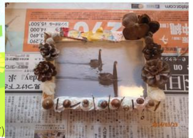
(参加者の作品です)

りぼんの形を作ったり、どんぐりにマスキングテープを巻いてみたり・・・アイディア満載の手作り写真立てができました！帰ったら早速、家族写真や、お友達との写真を飾る、という声が聞こえていました♪