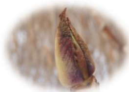
アジサイの冬芽 むき出しの状態 で葉脈が見えています

寒さから身を守ったり、鳥などに食べられるのを防いだり、生き延びていくための工夫がなされています。小さな冬芽、ぜひ見つけてみてくださいね。