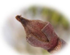
ヤマボウシの冬芽 2つの芽鱗に おおわれています

冬は花が咲かないどころか葉も落ちてしまふし、植物の観察には向かない時期…と思いがちですが、よくみると新しい発見や、冬にしか見せてくれない表情があります。特に「冬芽」を観察するととても面白いですよ。植物は冬の寒い時期も「冬芽」