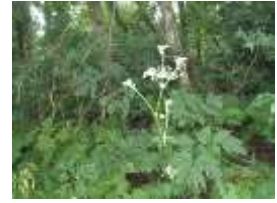
ミチノクヨロイグサ (花) (セリ科シシウド属)

胃腸薬として利用され、よく効くことから『実際に効く証拠』という意味で名が付けられました。観察できる場所：歴史ゾーンなど