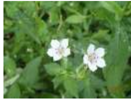
ゲンノショウコ (花) (フウソウ科/属)

鮮やかなピンク色の花が、茎から釣り下がって付きます。やや湿ったところを好みます。観察できる場所：自然観察園ゾーン