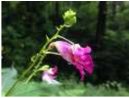
ツリフネソウ (花) (ツリフネソウ科/属)

鮮やかなピンク色の花が、茎から釣り下がって付きます。やや湿ったところを好みます。観察できる場所：自然観察園ゾーン