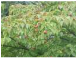
ヤマボウシ (実) (ミズキ科/属)

葉が重なり合う様子を鑑に見立てて名がつけました。高さ2mほどになるものもあります。観察できる場所：お休み広場ゾーン