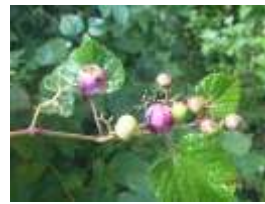
ノブドウ (実) (ブドウ科/ノブドウ属)

初夏に白い総苞片に包まれた花を咲かせ、9月頃に赤い実をつけます。観察できる場所：エントランスゾーンなど