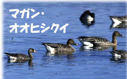
マガン・オオヒシクイ

ていて遠くからだで見分けがつかないかもしれません。写真の左側に写っているのがマガンです。オオヒシクイよりすこし体が小さく、くちばしは全体がオレンジ色で、その