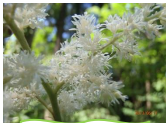
トリアシショウマ

自然観察園ゾーンなどで観察できるトリアシショウマ。芽だしの葉の形が鳥の足の形に似ていることから名がつけました。