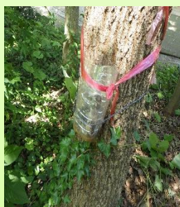
バナナトラップの仕掛け