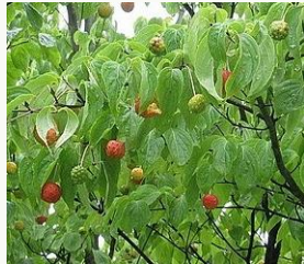
写真:ヤマボウシの実