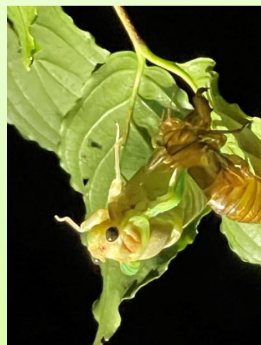
当日観察できたセミの羽化