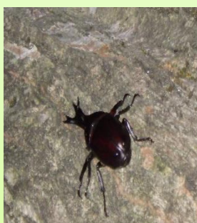
集まってきたカブトムシ