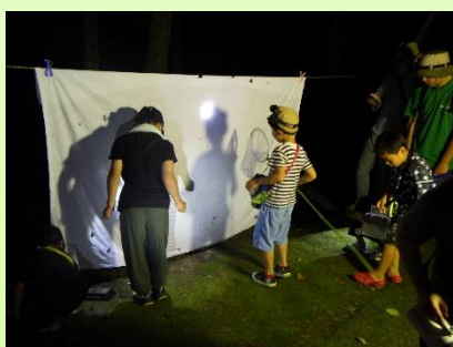
ライトトラップ開催の様子