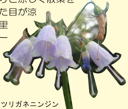
ツリガネニンジン

全ての花を見られる歴史ゾーンの園路は、ほとんど木陰となっているので、真夏でもわりと涼しく散策を楽しめます。また、見た目が涼しげなツククサは湊の里ゾーンやお休み広場ゾーン、ツリガネニンジン