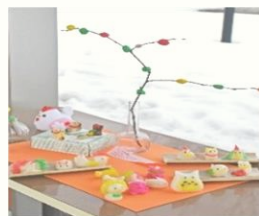
写真:作品イメージ

「ちんころ」とは？ 十日町の「節季市」で販売されて いる縁起菓子。米粉を練って、 犬や猫、干支などをつくります。