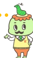
大潟水と森公園PRキャラクター かっぱかせ

Twitter・facebookも更新中! 大潟水と森公園 @mizutomori フォロー・いいね!お待ちしております